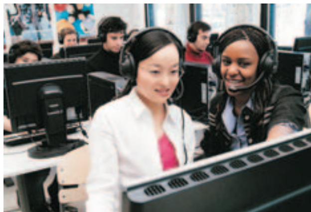
В SANAKO Lab 300 учителя полностью контролируют класс