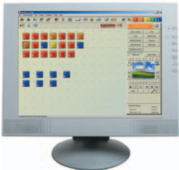
Программа Учителя SANAKO Lab 300

Sanako Lab 300 предлагает фантастические возможности для проведения интересных, эффективных уроков. Сочетание интерфейса студента - виртуального цифрового магнитофона Media Assistant Duo с возможностями управляющей Программы Учителя Lab 300 позволяет в полной мере использовать существующие медиа ресурсы. Lab 300 Media Assistant Duo имеет много важных и полностью интерактивных функций, включая оцифровку, сохранение в различных форматах, создание субтитров и установку закладок.